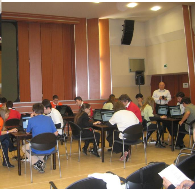
Koncentrált munka az online kvíz fordulóban