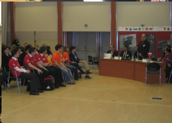
Az eredményhirdetés feszült pillanatai