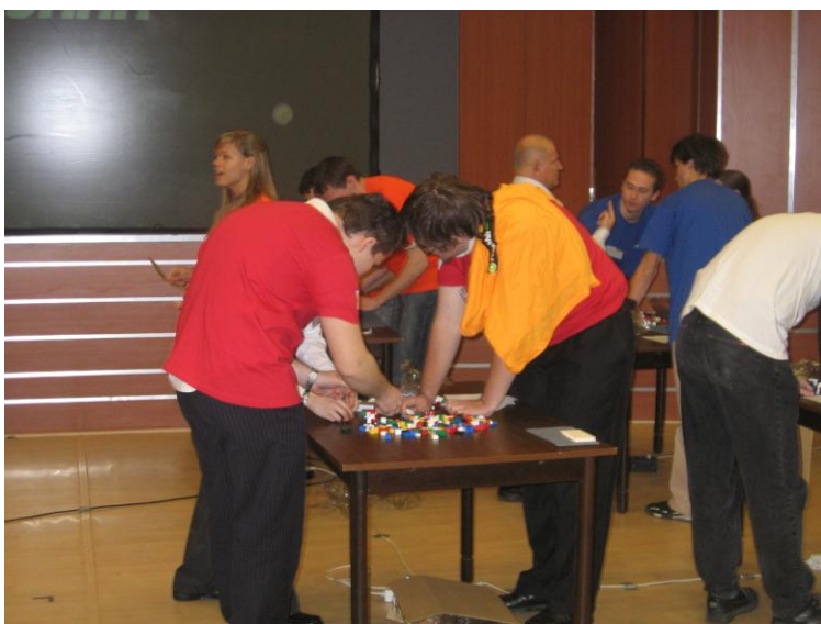
A kreatív forduló feladatának megoldása közben

Döntő: Százhalombatta, Dunai Finomító, 2010. 12. 10.